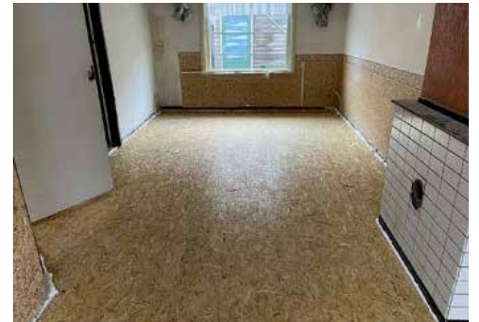
Volledige vloerrenovatie in één dag.

'De vloer is vaak een ondergeschoven kindje'