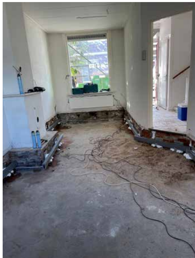
Alle oude, houten materialen worden uit de woning gesloopt.

Het Compofloor renovatievloersysteem bestaat uit cassettes van composiet (glasvezelversterkt kunststof), die worden gevuld met een hoogwaardig isolatiemateriaal. Kemp: “Zo krijg je een hoogwaardige vloer, die makkelijk met twee mensen te tillen is. Daarmee kunnen we oude vloeren in één dag vervangen en kunnen bewoners dus weer snel in hun woning.”