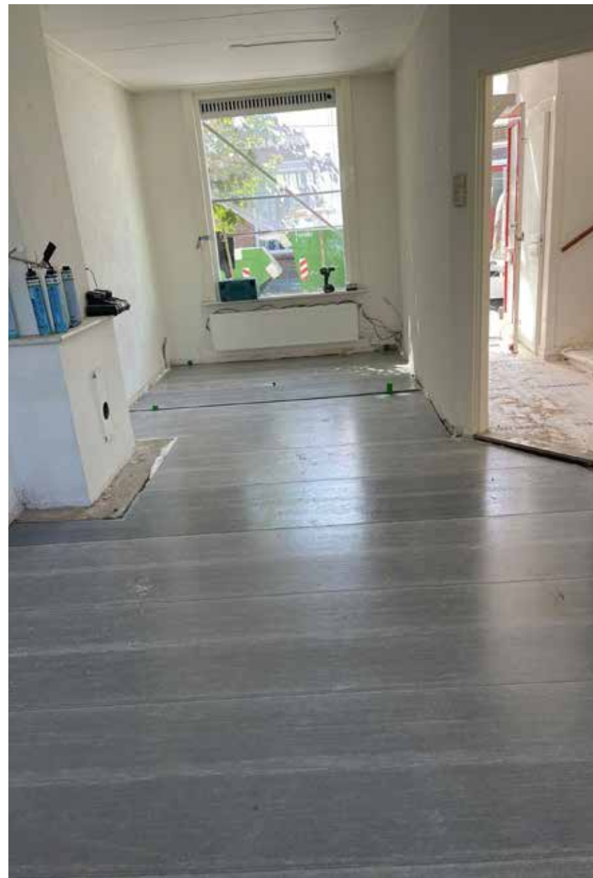
Compofloor renoveert de vloeren van de woningen aan de Javastraat en omgeving.