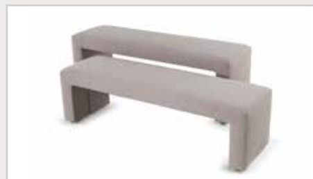
Bank Reposa/ Reposa XL L140 x B41 x H41cm/ L140 x B41 x H50cm