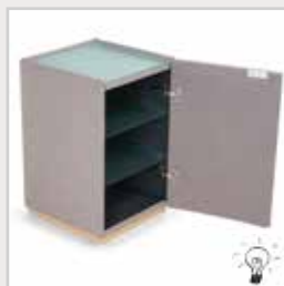
Versus de Luxe H:60 x B40 x L39cm