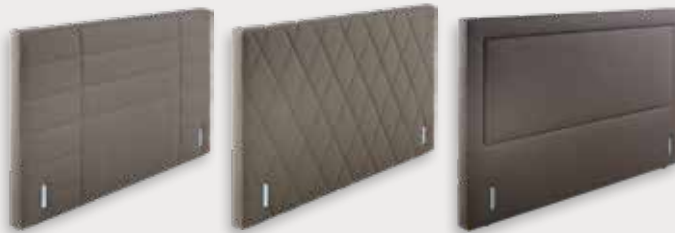
Smart H112 - D11cm Diamond H112 - D11cm Mirage H123 - D12cm