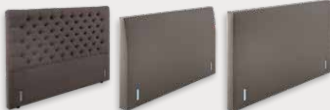
Nelson H135 - D12cm Mania H110/92 - D15cm Rock H110/92 - D12cm