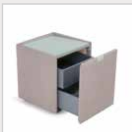
Versus Secret H41 x B41 x L48cm