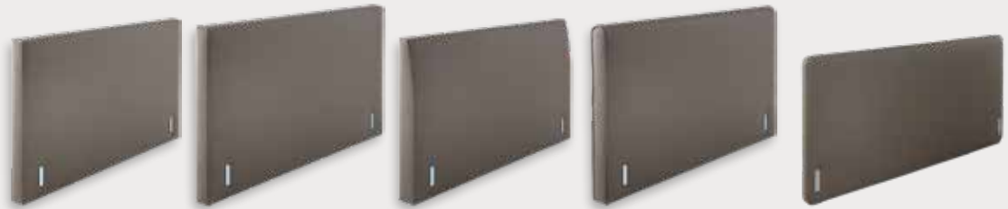
Recto H92/110 - D12cm Square H92/110 - D12cm Flexion H92/110 - D15cm Arch H97/115 - D12cm Slender H92/110/112 - D72cm