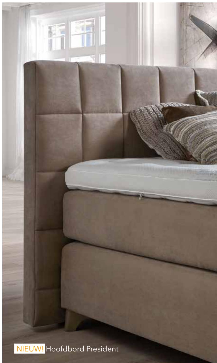
NIEUW! Hoofdbord President