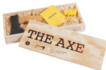
De Axe houtklover