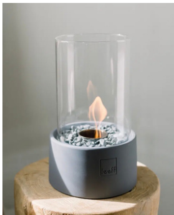
Tafelhaard stonefire grijs