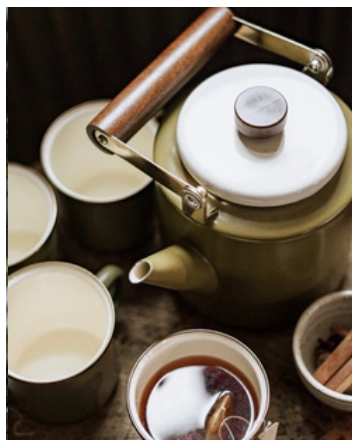
Theepot Two tone Olive