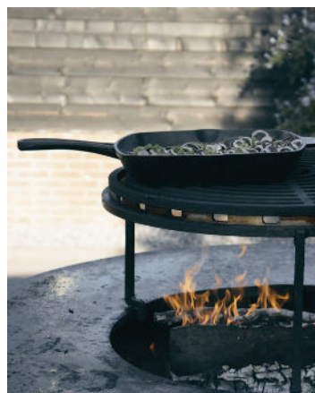
Grillpan gietijzer vierkant