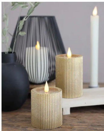
Pilaarkaars LED goud