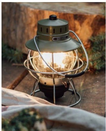
Railroad Lantern Olive