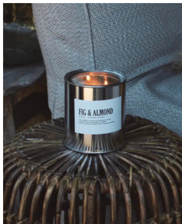
Buitenkaars Fig Almond