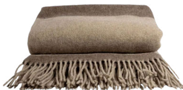
Plaid Ulle Beige Bruin